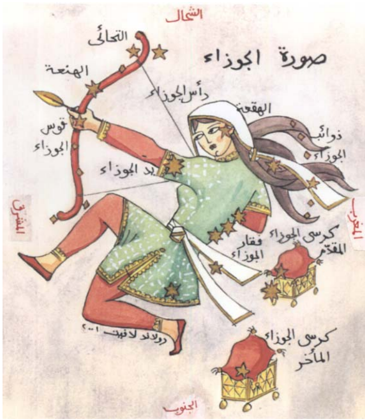
La constellation arabe d'al-Jawzâ'