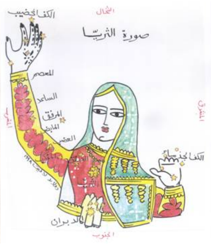
La constellation arabe d'al-Thurayyâ